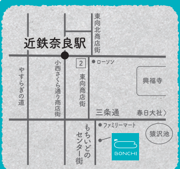
イラスト / 槌野千敏 (NPO 法人ないるサーカス団) デザイン / daichusho